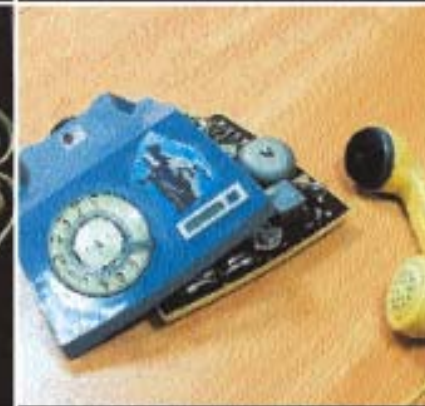
несвоевременно вызваны пожарные