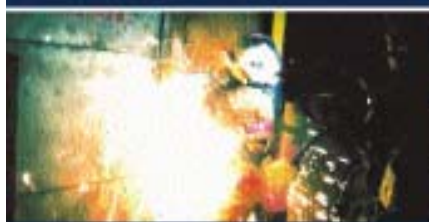
сварочные работы, окурки