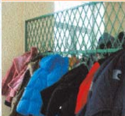
шторы, занавески, одежда