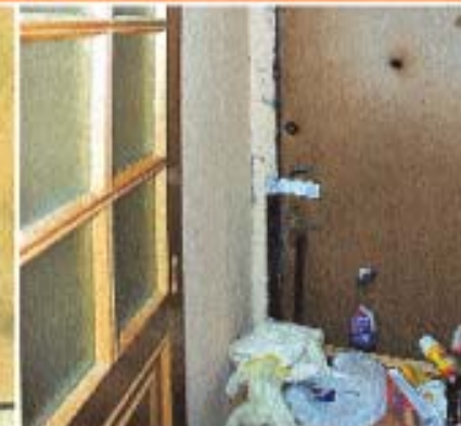
отсутствуют запасные выходы или они захламлены