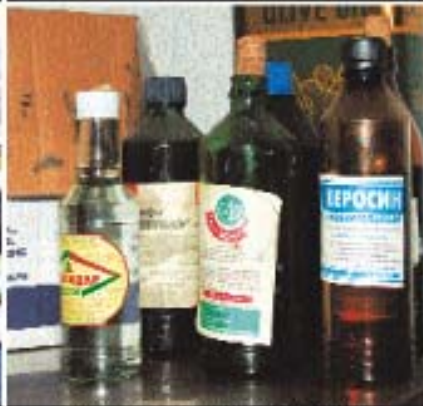
пожаро- и взрывоопасные вещества