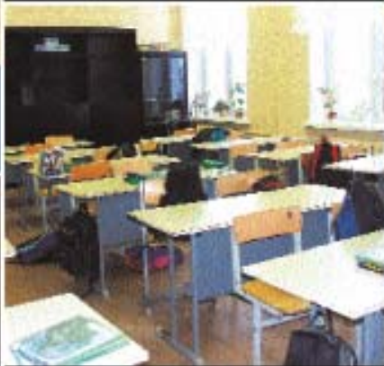
мебель, пластиковая облицовка