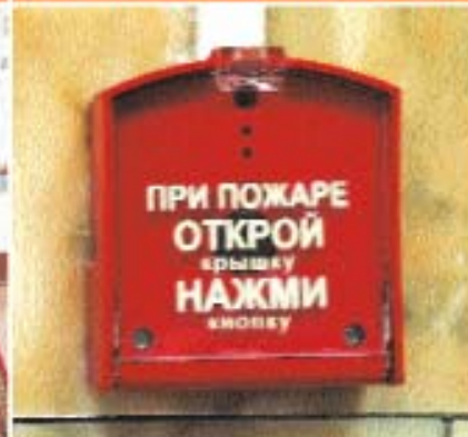
отсутствует или неисправна пожарная сигнализация, не хватает средств пожаротушения